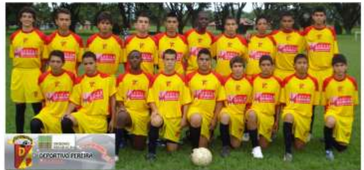
Foto: Categorías Inferiores Deportivo Pereira años 93 - 94 Primera C Visita instalaciones Deportivas Ingenio Risaralda S.A.

Y para los hijos de los trabajadores está la Escuela de Fútbol donde en el 2008 participaron 45 jóvenes hijos de trabajadores que recibieron instrucciones y clases de fútbol por parte del personal técnico en esta modalidad.